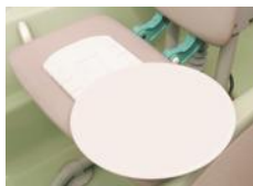
着座後の移動や方向転換に便利なスライド式ターンテーブル ¥29,800 (税抜)